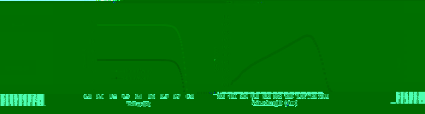
電極電阻 (A) 電極電阻 (A) 電極電阻 (A) 電極電阻 (A) 電極電阻 (A) 電極電阻 (A)